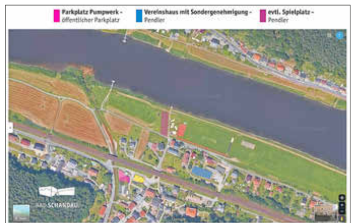
Parkmöglichkeiten in Krippen