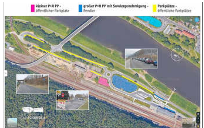
Parkmöglichkeiten linkselbisch am Nationalpark-Bahnhof