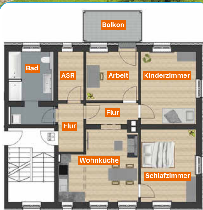
Beispielgrundriss mit Beispielmöblierung

Unsere frisch und energieeffizient sanierten 3- bis 4-Zimmer-Wohnungen lassen die Herzen von Familien höher schlagen. Durchdachte Grundrisse, moderne Bäder und große Balkone schaffen eine heimelige Wohlfühlatmosphäre.