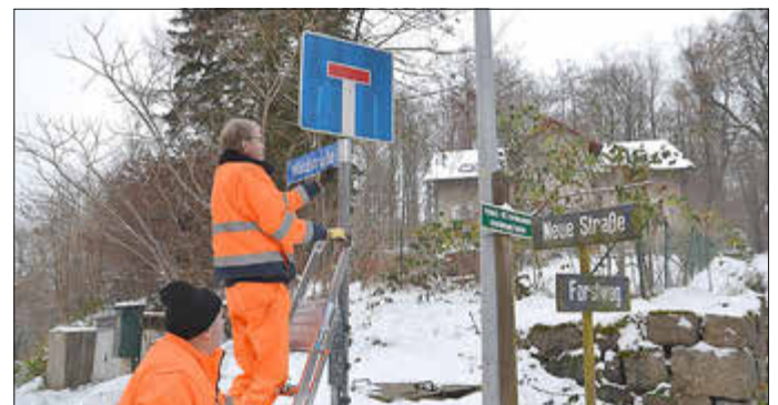
Foto: Mitarbeiter der TDS - Tourismus- und Dienstleistungsgesellschaft Sebnitz mbH beim Montieren des neuen Straßennamensschildes „Waldstraße“ in Sebnitz.

Mit diesem Projekt folgen Stadtrat und Verwaltung einer Forderung aus der Eingemeindungsvereinbarung zwischen der ehemaligen Gemeinde Kirnitzschtal und der Großen Kreisstadt Sebnitz. Zuletzt war die Umbenennung der doppelten Straßennamen ein zentrales Thema während der Einwohnerversammlungen 2024.