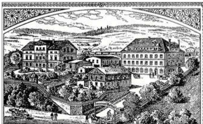
Immanuel Richter, älteste Blumenfabrik in Sebnitz Bahnhofstr. 5

Diese Firma war die älteste in Sebnitz und befand sich zunächst an der Neustädter Straße, später an der Bahnhofstraße Nr. 5. Wie aus der Zeichnung zu erkennen ist, war es auch ein ganz schöner Komplex und stand zwischen Bahnhofstraße und Bahndamm. Oberhalb dieses Geländes stand das alte Schützenhaus, das wegen dem Bahnbau abgerissen wurde. Oberhalb des Bahnhofes erhielten die Schützen ein neues.