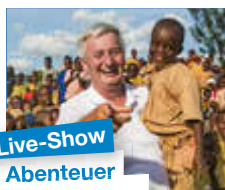
Live-Show Abenteuer Weltumrundung