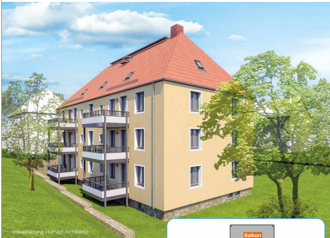
Visualisierung: Hufnagl Architektur

Familien aufgepasst: Unsere frisch sanierten Wohnungen ab Februar 2026