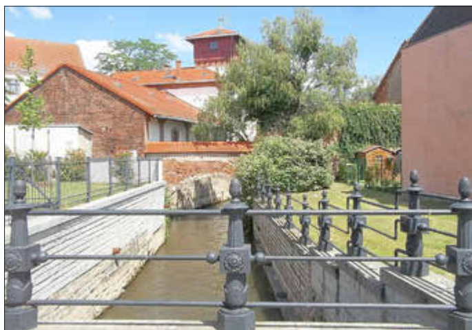
Elstermühlgraben Pegau

Wie können Sie den Gewässerrandstreifen denn nun sonst nutzen? Sie könnten sich zum Beispiel eine kleine Naturoase schaffen. Pflanzen Sie dazu standortgerechte Gehölze wie Schwarzerle oder Weidenarten und kreieren Sie sich so ein schattiges Plätzchen am kühlen Bach für heiße Sommertage. Das reduziert auch gleich noch die Wassertemperatur. Wenn Sie Gräser und Stauden am Ufer nur zweimal im Jahr mähen, schaffen Sie mit Blühstreifen wertvolle Lebensräume u.a. für unsere Bienen und Schmetterlinge.