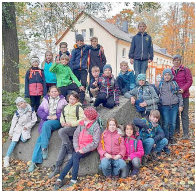
Die Musiker der Grundschule Rosenstraße

Ein herzlicher Dank für die Organisation des Probenlagers sowie für die musikalische Leitung und dem Vorstand des JBO, der das Wochenende im KIEZ ermöglicht hat.