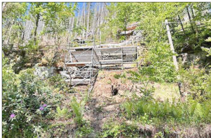
Gerüstkonstruktion zur Mauerinstandsetzung – Talstraße Lichtenhain

Die Arbeiten wurden im Vorfeld vollumfänglich begutachtet und von den zuständigen Fachbehörden genehmigt. Die Bauzeit erstreckt sich bis Oktober 2025. Die Arbeiten werden von der Fa. MONTAG Straßen- und Tiefbau GmbH & Co. KG ausgeführt. Das Vorhaben wird zu 100 % gefördert und kostet ca. 200.000 Euro.