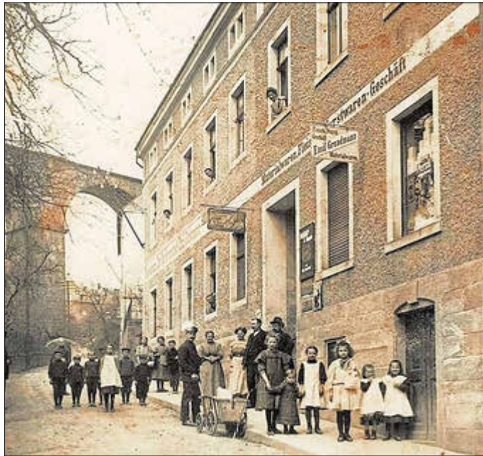
Gaststätte „Nordvorstadt“

Das Gasthaus war für die Bewohner des Knöchels die nächstliegende Einkehrstätte, denn in der Genossenschaft gab es keine Gaststätte. Zur Gaststätte „Nordvorstadt“ an der Neustädter Straße gehörte ein Materialwaren- sowie ein Fleisch- und Wurstwarengeschäft. In den fünfziger Jahren erteilte in dem Haus ein Fräulein Stein Kindern Ballett-Unterricht. Später befand sich hier eine Zeit lang die Hygieneinspektion des Kreises Sebnitz. Es wurde abgetragen.