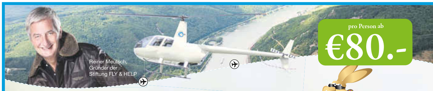
Reiner Meutsch, Gründer der Stiftung FLY & HELP