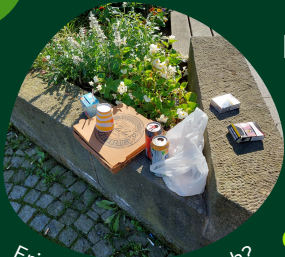
Erinnerst Du Dich noch?

Das Ziel dieser Kampagne ist es, das Bewusstsein für eine saubere Stadt und einen verantwortungsvollen Umgang mit der Umwelt zu schärfen, ohne dass es uns viel Mühe oder zusätzliche Kosten bereitet. Es erfordert lediglich ein wenig Mut, neue Wege zu gehen , sowie Aufmerksamkeit und Sorgfalt.