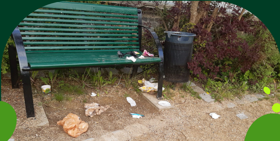
Bank im Sängertof

Es sieht unansehnlich und nicht einladend aus – weder für Einwohner noch für Besucher unserer Stadt.