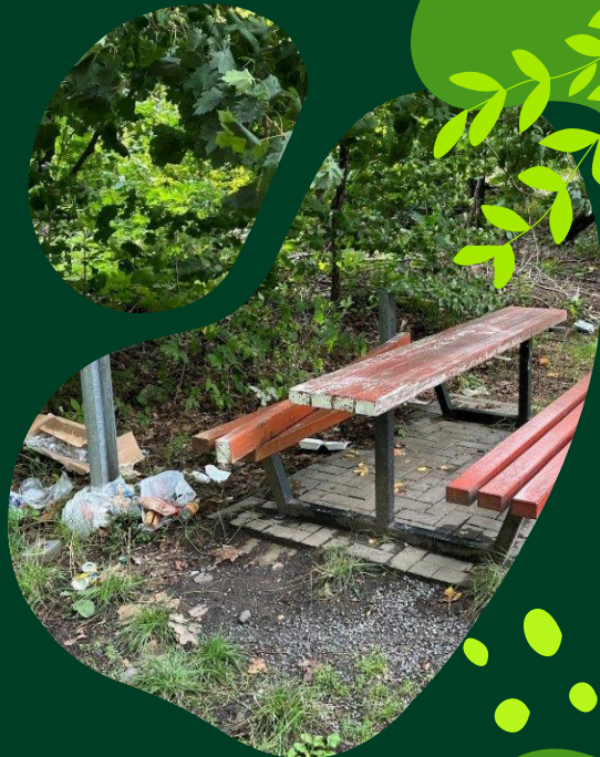
Bank am Nassweg