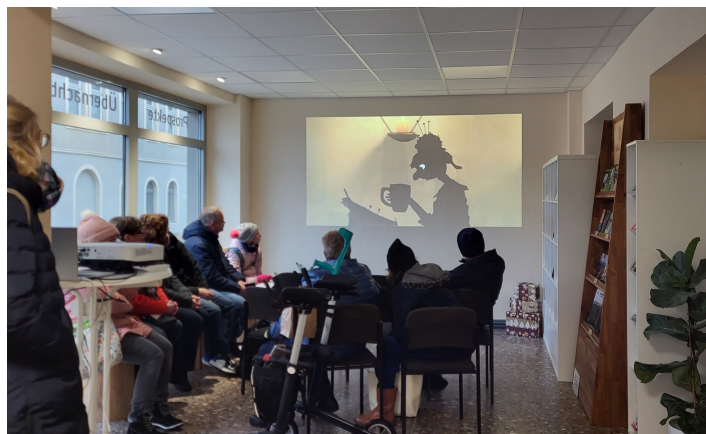
Scherenschnitt-Kino in der Touristinformation