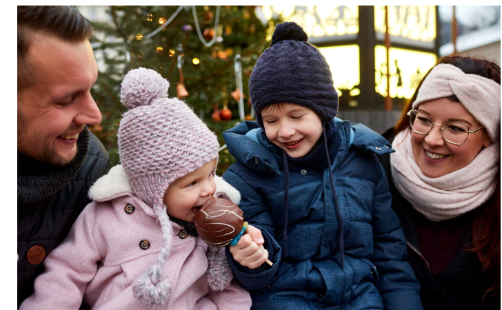
Weihnachtsstimmung in Familie

Die Veranstalter der 9. Sebnitzer Tannert-Weihnacht freuen sich über die positive Resonanz und bedanken sich herzlich bei allen Teilnehmern, Besuchern und Unterstützern, die dieses stimmungsvolle Fest erst möglich gemacht haben. Die gelungene Kombination aus Tradition und neuen Ansätzen lässt Vorfreude auf die kommenden Jahre aufkommen, wenn die Sebnitzer Tannert-Weihnacht erneut ihre Tore öffnet und die Besucher in eine magische Welt aus Licht und Schatten(spielen) entführt.