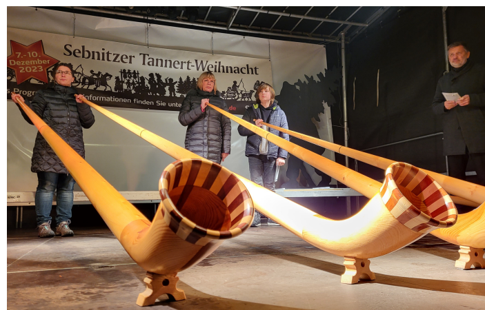
Alphornklänge auf der Bühne

Auch musikalisch wurde den Gästen ein umfangreiches Programm geboten. Chöre und Musiker aus der Region sorgten für festliche Klänge und trugen zur besinnlichen Stimmung bei.