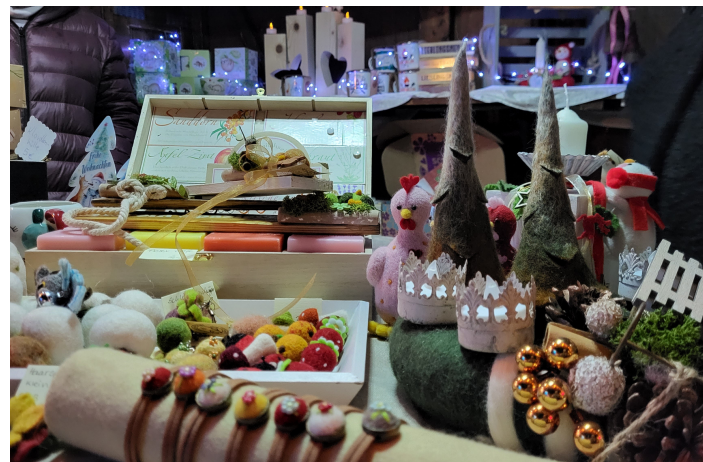
Geschenkideen an den Ständen

Neben dem Scherenschnittkino bot die 9. Sebnitzer Tannert-Weihnacht zahlreiche weitere Attraktionen für die ganze Familie. Der traditionelle Weihnachtsmarkt auf dem Marktplatz begeisterte mit festlich geschmückten Ständen, handgefertigten Kunsthandwerken und kulinarischen Köstlichkeiten.