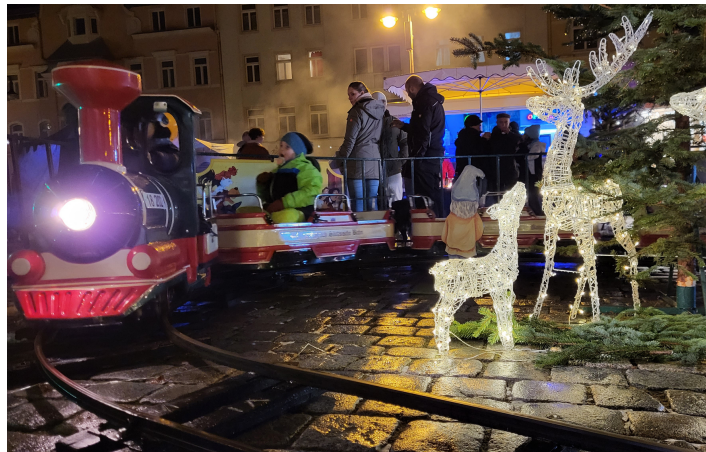
Kinder-Eisenbahn, Foto: Stadtmarketing

Vom 7. bis zum 10. Dezember 2023 verwandelte sich Sebnitz erneut in ein zauberhaftes Weihnachtsdorf, um die neunte Ausgabe der Sebnitzer Tannert-Weihnacht zu feiern. Die Veranstaltung lockte Besucher aus Nah und Fern und bot vier Tage lang ein facettenreiches Programm, das traditionelle Elemente mit neuen Highlights vereinte.