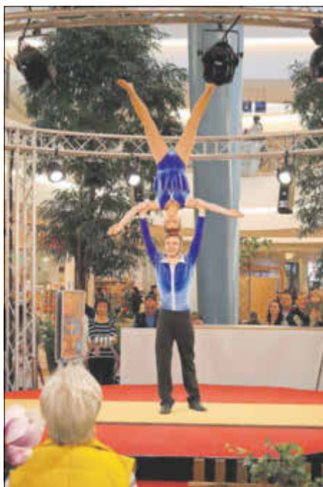
Wir danken allen Helfern und Partnern für die großartige Zusammenarbeit.