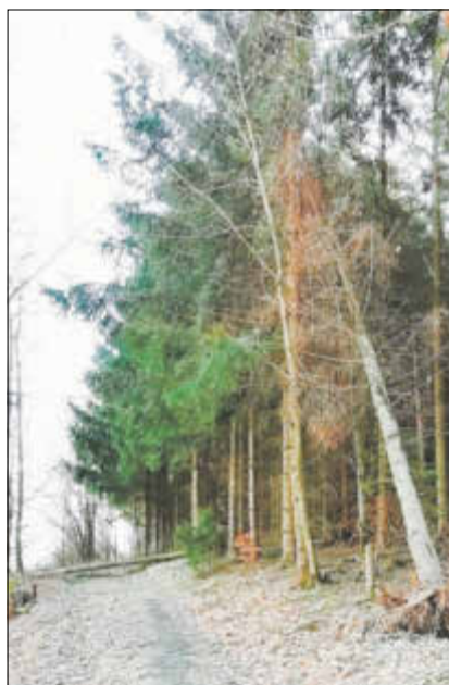
Wanderweg am Fuße des Finkenberges

Ganz dringend werden für die Betreuung Finkenberg bis Gersenberg, Ortslage Lichtenhain und Hochbusch, Schönbach, Goldgruben und Amtshainersdorf flinke Füße und fleißige Hände gesucht. Also wer Freude am Wandern und an unserer schönen Natur und Umgebung hat, meldet sich bitte bei Frau Mutze, Sachgebiet Wanderwege (Tel. 035971 84213 oder christiane.mutze@stadtverwaltung-sebnitz.de ).