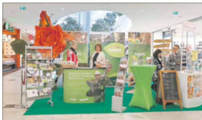
Einer der liebevoll gestalteten Stände im Dresdener Elbepark 2018

Begonnen wurde im neuen Jahr bereits mit der Zwickauer Reisemesse und der Grünen Woche ehe es dann im März um ein vielfaches größer wird und in Kooperation mit dem Sebnitzer Hof die Präsentation zur internationalen Tourismusbörse in Berlin stattfindet.