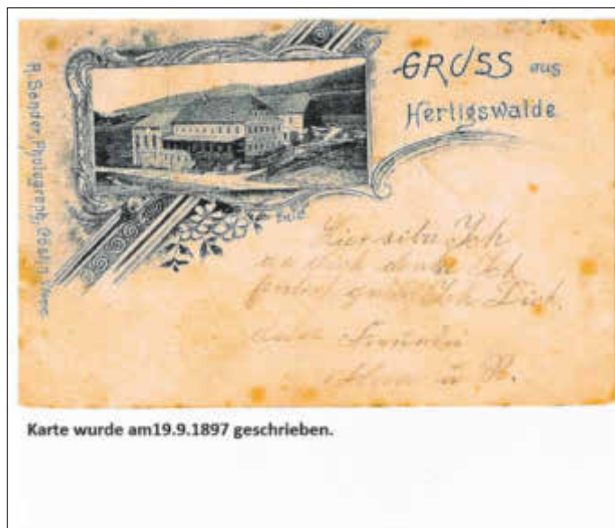
Karte wurde am 19.9.1897 geschrieben.