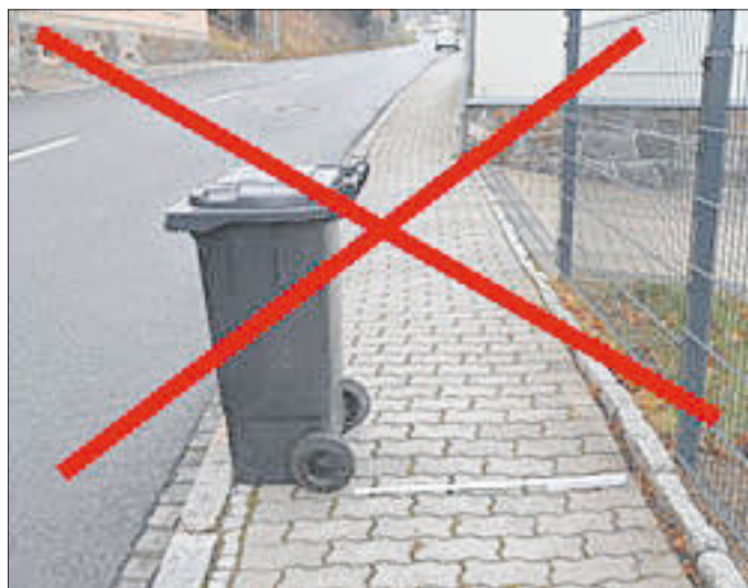
Ein Standort: so geht es nicht

Diese Personen müssen in den Bereich der Straße ausweichen. Das stellt eine akute Gefährdung der Passanten dar. Wir bitten alle Hauseigentümer – und dass nicht nur in Hertigswalde – die Mülltonnen am Entsorgungstag so aufzustellen, dass eine ungehinderte Gehwegbenutzung möglich ist. Die Mülltonne muss nicht vorn auf dem Gehweg stehen. Freie Flächen und Zugänge an den Grundstücken bieten ausreichend Platz für die Aufstellung am Entsorgungstermin.