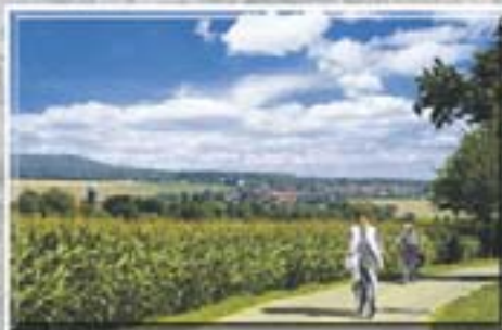
Blick auf Lohmen