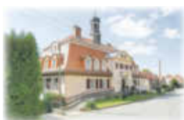
Hohnstein: ca. 50 m 2 & 65 m 2 , 2-Zi.-Whg., im Obergeschoss, ASB-Sozialstation im Haus

Die drei Wohnungen befinden sich in optimaler und landschaftlich reizvoller Lage. Beide Häuser sind mit Fahrstuhl und Gemeinschaftsraum ausgestattet. Hier können Sie wohnen, wo andere Urlaub machen.