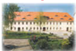
Lohmen: ca. 45 m 2 , 2-Zi.-Whg., im Obergeschoss

Gutshofflügel Lohmen und Waldstraße Hohnstein