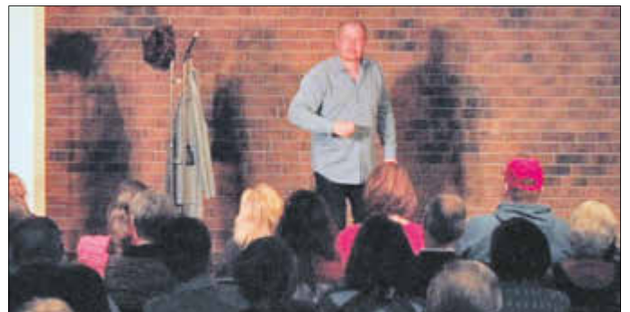
(Auszüge, Neues Grenzblatt Nr. 13 vom 29.03.2018)