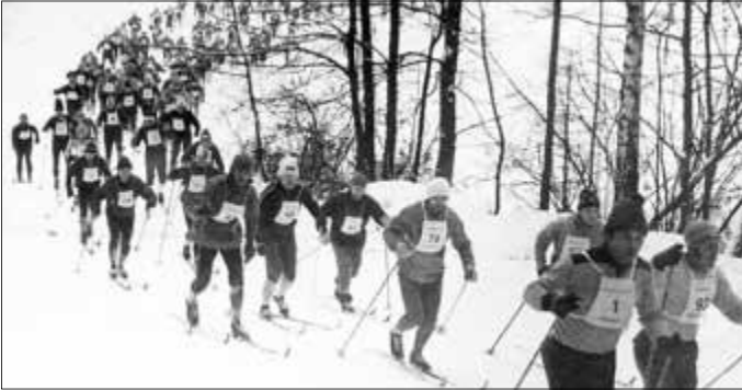
(Auszüge, Neues Grenzblatt Nr. 4 vom 26.01.2018)

Die Stadt Sebnitz unterstützt den diesjährigen Wuchterlauf mit finanziellen Mitteln aus der Vereinsförderung.