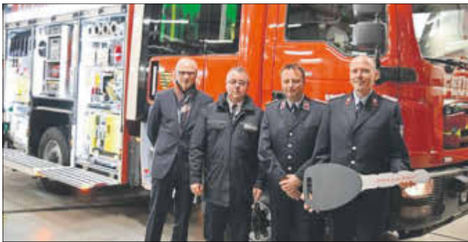
(Auszüge, Neues Grenzblatt Nr. 51 vom 21.12.2018)

Am 11. Dezember wurde im Gerätehaus der Freiwilligen Feuerwehr Sebnitz das neue Fahrzeug HLF 10 - Hilfeleistungslöschfahrzeug - offiziell in Betrieb genommen. Es handelt sich dabei um ein wasserführendes Fahrzeug mit 1.000 Liter Wasser. Das Allroundfahrzeug ist u. a. mit einer fest eingebauten Pumpe, Notstromversorgung und Beleuchtung sowie mit moderner Rettungstechnik ausgestattet und kommt bei der Brandbekämpfung und technischen Hilfeleistung zum Einsatz. Das Fahrzeug ist dem „Löschzug Retten“ des Katastrophenschutzes des Landkreises Sächsische Schweiz-Osterzgebirge untergeordnet. Das HLF 10 ist vom Freistaat Sachsen beschafft und finanziert worden und ersetzt das in die Jahre gekommene Löschfahrzeug LF 16 TS am Standort der Ortsfeuerwehr Lichtenhain.