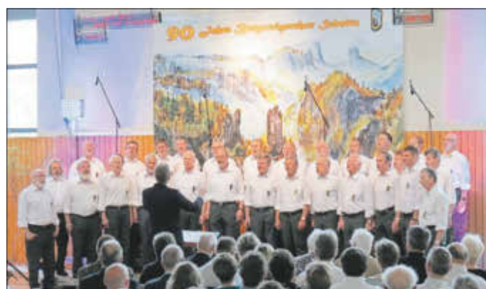
(Auszüge, Neues Grenzblatt Nr. 19 vom 11.05.2018)