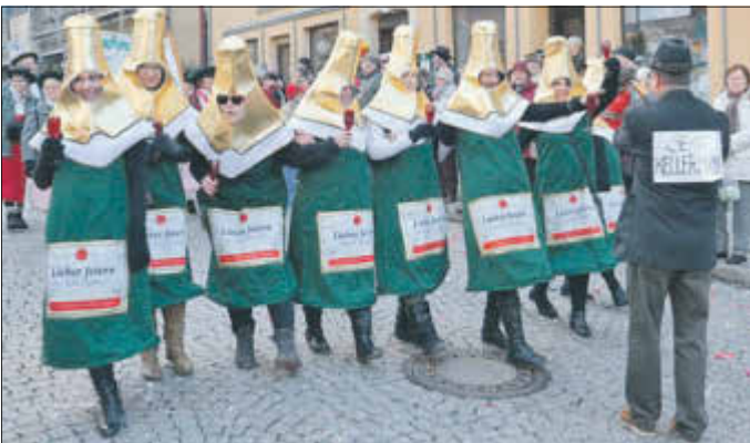
(Auszüge, Neues Grenzblatt Nr. 7 vom 16.02.2018)