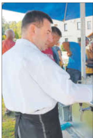
Der Landtagsabgeordnete Jens Michel brachte ein Fass Freibier mit, welches er auch gleich persönlich für die Gäste zapfte.

Das Projekt entstand im Rahmen des Wettbewerbsbeitrages des Sächsischen Landeskuratorium Ländlicher Raum e. V. „Blickpunkte – Kunst im ländlichen Raum“ und wurde zu 100 % gefördert!