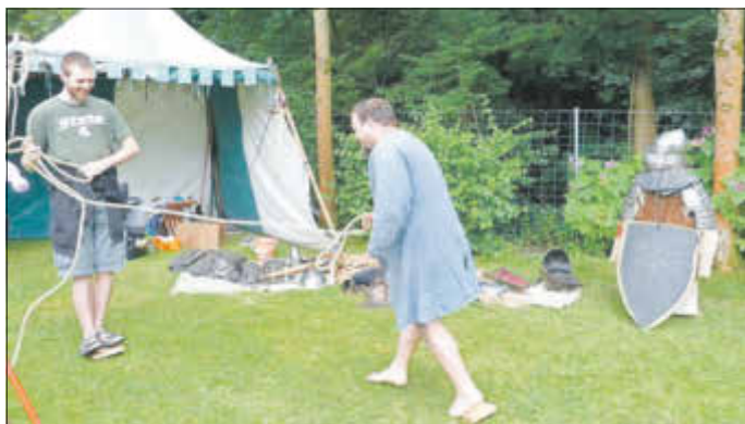
Wer sich bei den Ritterspielen bewies, konnte eine echte Urkunde mit nach Hause nehmen.