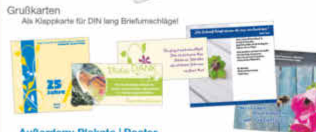
Grußkarten Als Klappkarte für DIN lang Briefumschläge!

Außerdem: Plakate | Poster Broschüren | Zeitschriften u.v.m.