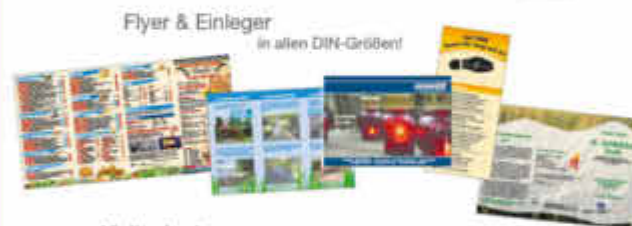
Flyer & Einleger in allen DIN-Größen!