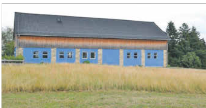
Entsteht hier der neue Erlebnishof?

Die komplette Studie und nähere Informationen zum Projekt können unter https://rathaus.sebnitz.de/leben-und-kultur/demografie/ abgerufen werden. Diese Maßnahme wird mitfinanziert mit Steuermitteln auf Grundlage des von Abgeordneten des Sächsischen Landtages beschlossenen Haushaltes.