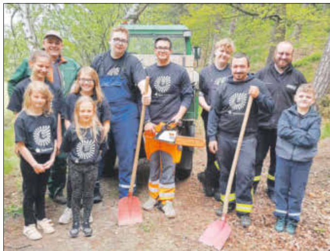
Die Jugendfeuerwehr Altendorf war am Gerätehaus aktiv, hat ein Anschlagtafel im Hegebusch errichtet und führte eine Altkleider- und Altpapiersammlung durch.