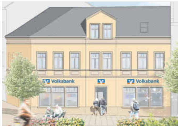
Grafische Darstellung des neuen Standortes der Volksbank Pirna/Sebnitz e. V. am Markt 1 in Sebnitz.