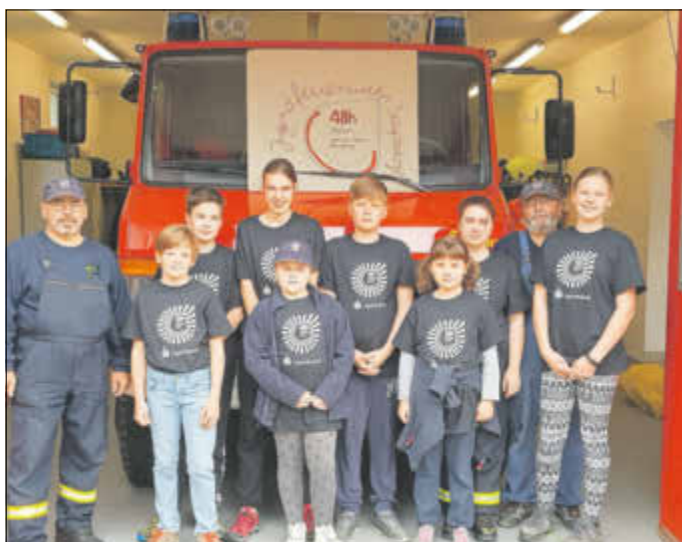
Die Jugendfeuerwehr Saupsdorf hat Geländer und Sitzgruppe am Gerätehaus sowie das Geländer am Löschteich gestrichen.