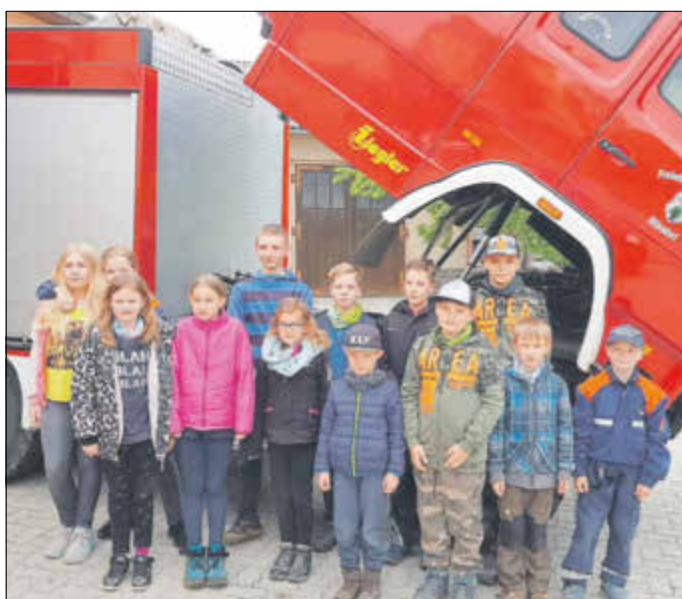
Die Jugendfeuerwehr Ottendorf hat den Rundwanderweg um Ottendorf aufgewertet, den Rastpunkt am „Heidetor“ neu gestaltet und Bäume gepflanzt.

An dieser Stelle sei allen Jugendlichen gedankt, die an dieser Aktion teilgenommen haben. So etwas sollte Schule machen. Etwas gemeinsam Geschaffenes erfährt außerdem mehr Wertschätzung und macht natürlich stolz! Weiter so!