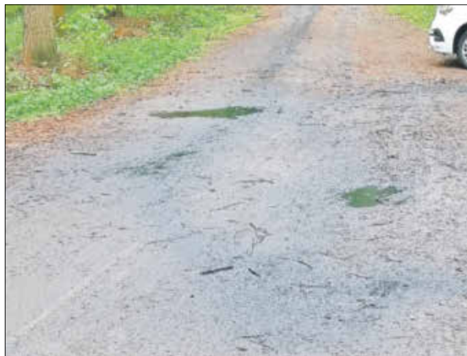
Hohe Straße - Verbindung zwischen Lichtenhain und Ottendorfer Wasserbehältern

Sachdienliche Hinweise nimmt das Polizeirevier Sebnitz (Tel. 035971 850) und die Stadtverwaltung Sebnitz, Ordnungsamt (Tel. 035971 84251), entgegen.