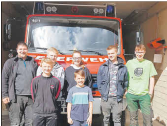
Die Jugendfeuerwehr Hinterhermsdorf hat sich dem Wegebau/ Reparatur/Freischneiden von der Nixdorfer Straße bis zur Finnhütte am Fuße des Weißbergturmes gewidmet.