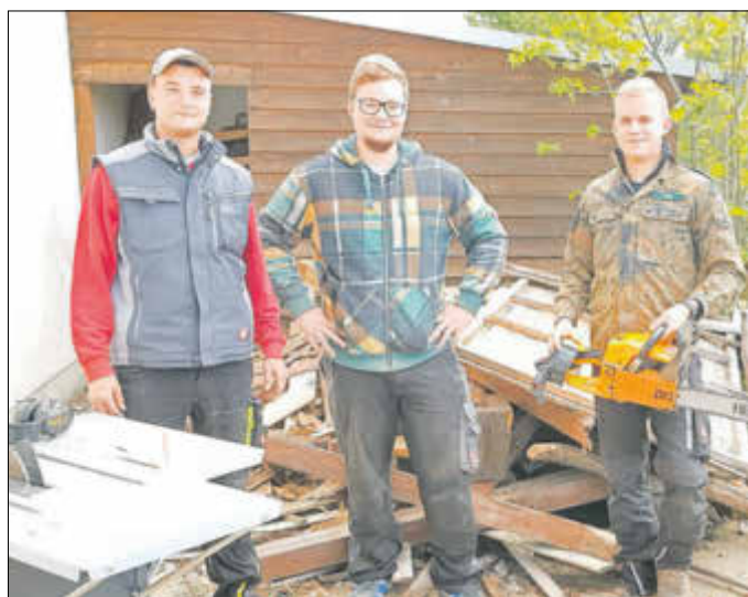
Die Jugendlichen vom Jugendclub Lichtenhain haben eine Komplettreinigung der Räumlichkeiten des Jugendclubs vorgenommen und Holz gesägt.