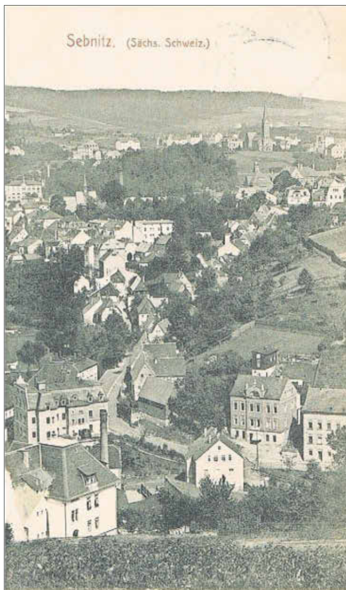
Karte geschrieben 26.4.1909 -Blick von der Hube-