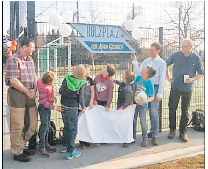
Einweihung des Bolzplatzes am neu gestalteten Dorfplatz Mittelndorf durch Sachsens Ministerpräsident Michael Kretschmer.