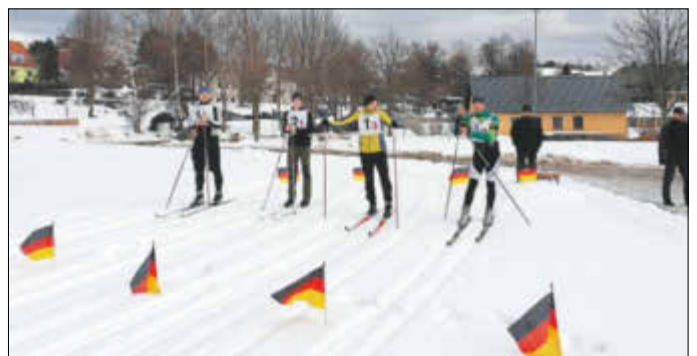
Der Biathlonwettbewerb in Hinterhermsdorf am 9. Februar fand bei besten Wetterverhältnissen statt.