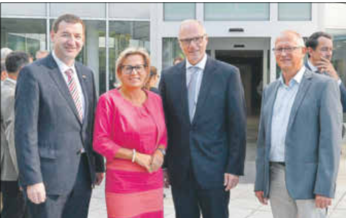
Sachsen und Tschechien vereinbaren grenzüberschreitende Gesundheitsvorsorge.