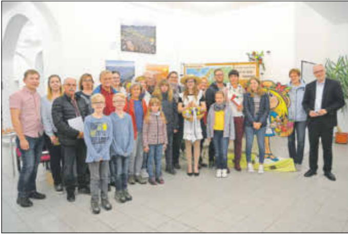
Abschluss des Fotowettbewerbs „Lotte auf Reisen“. Ausstellung dazu ist im Foyer des Sebnitzer Rathauses zu sehen.