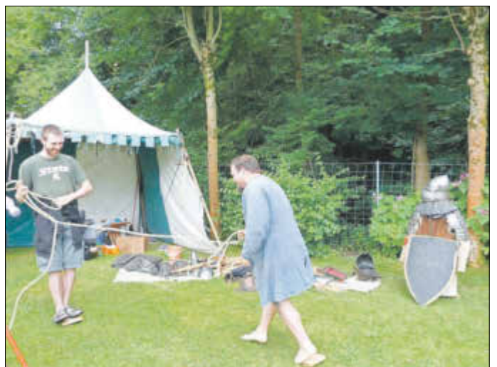
Badfest 2019 – unter dem Motto „Mittelalter“ war das Familienfest bei angenehmen 25 °C und Sonnenschein bestens besucht.