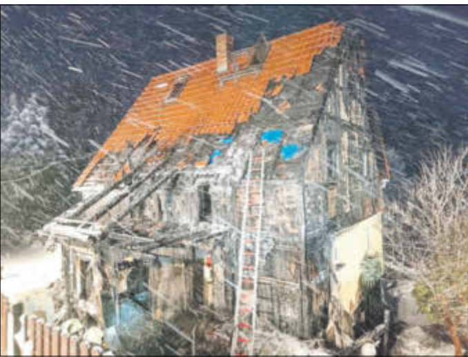
Hausbrand in Hertigswalde – vierköpfige Familie verlor am 10. Januar ihr zukünftiges Zuhause – private Spendenaktion wurde ins Leben gerufen.