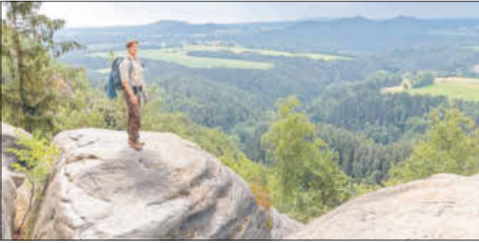
Dreharbeiten für den „Ranger“, Teil 3 und 4, fanden statt.