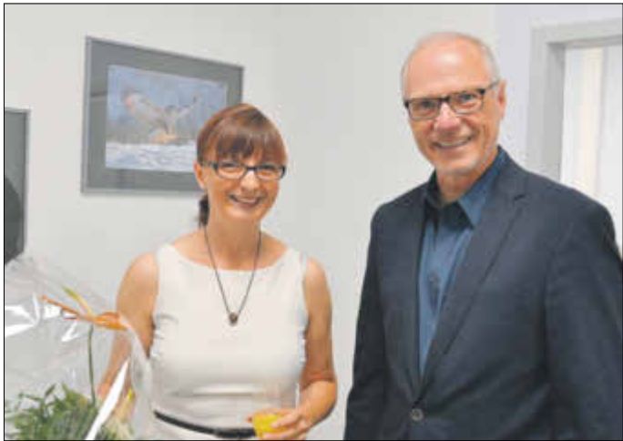
Im Rahmen des „Förderprogramms Innenstadt“ der Großen Kreisstadt Sebnitz werden erste zinsfreie Zuschussbeträge ausgezahlt.