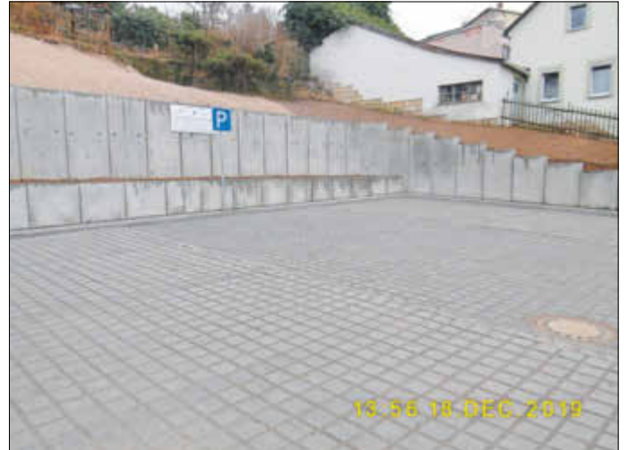
Fertigstellung der Parkflächen am Standort Weberstraße 12.