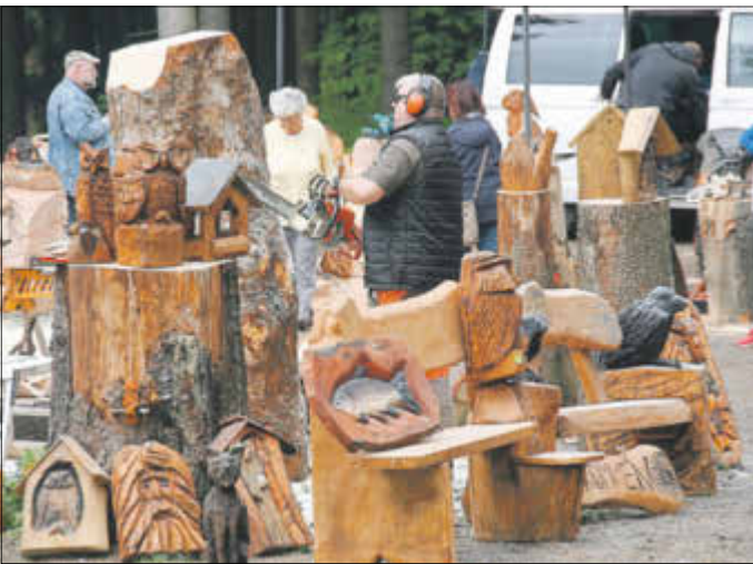
Kettensägen-Wochenende auf dem Wachberg in Saupsdorf, u. a. mit einigen Ständen des Saupsdorfer Freizeitvereins.