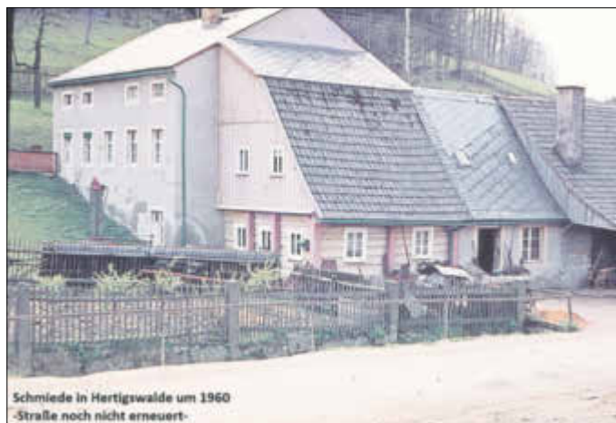
Schmiede in Hertigswalde um 1960 -Straße noch nicht arnesuert-

Hier an der Schmiede konnten wir Hertigswalder Schulkinder miterleben, wie der Sturm-Schmied den Pferden neue Hufeisen aufsetzte. Der Geruch zog bis in die Klassenzimmer.