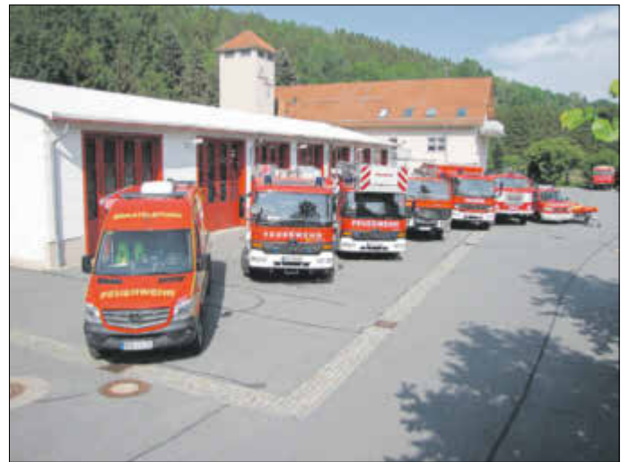
Stadtrat beschloss neue Brandschutzbedarfsplanung und sorgt damit für mehr Sicherheit im Gemeindegebiet.