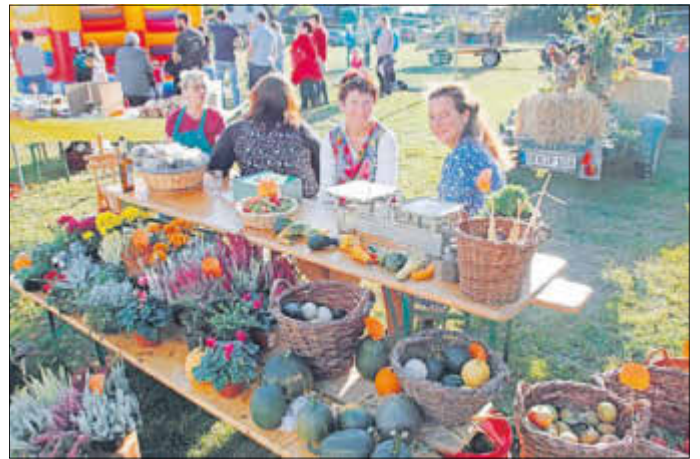
In Ottendorf gibt es immer etwas zu feiern, so die Sonnenwenden, das Erntedankfest oder das Maibaumsetzen, organisiert durch den Kleingartenverein und den Feuerwehrverein Ottendorf e. V.