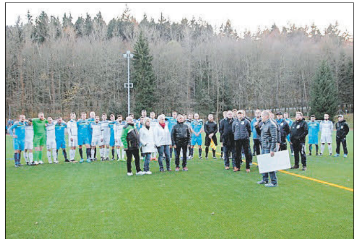
Spendenaufwurf für schwer kranken Jungen aus Sebnitz – Stadt Sebnitz unterstützte die Aktion. Nach Zusage zur Kostenübernahme durch die Krankenkasse werden die bereits eingegangenen Spendengelder – falls diese nicht zur Behandlung benötigt werden – an die Deutsche Muskelstiftung weitergereicht. Auch der BSV 68 Sebnitz e. V., Abt. Fußball, hat sich mit der Durchführung eines Benefizspiels an der Spendenaktion beteiligt.