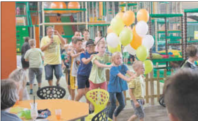
Spielparadies Kinder-Tobeland wurde mit vielen neuen Spielgeräten im August wiedereröffnet.