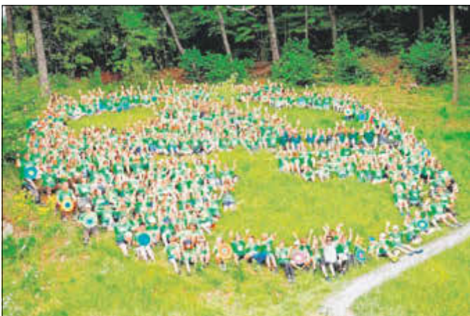
Zum bundesweiten Junior-Ranger-Treffen in Hinterhermsdorf waren 320 Kinder und Jugendliche angereist und erlebten ein paar tolle Tage, beim Klettern, Wandern, Natur etc.