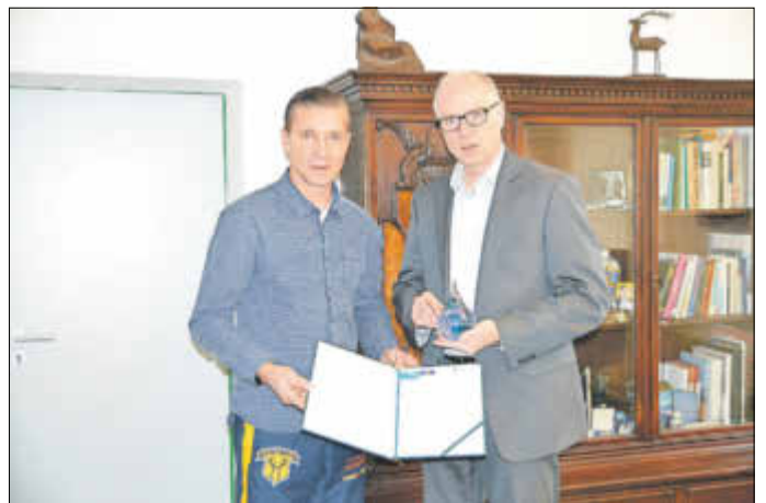
Das seit 2009 bestehende „Hockey-Projekt“, welches die Stadt Sebnitz gemeinsam mit der tschechischen Nachbarstadt Dolni Poustevna durchführt, wurde im Rahmen einer Preisverleihung der Euroregion Neisse-Nisa-Nysa am 22.11.2019 gewürdigt.