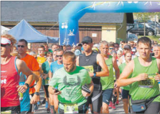
Über 1.700 Teilnehmer waren zur 11. Sparkassen Panoramator am 10./11. August nach Hinterhermsdorf gereist; zusätzlich über 900 nahmen am Festungslauf in Königstein teil: Teilnehmerrekord!