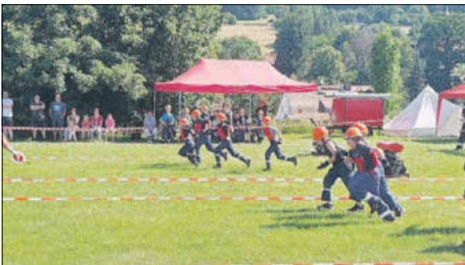
Aktives Feuerwehrleben in Ottendorf: Frühlingswanderung in Hřensko, internationale Feuerwehrsternfahrt nach Österreich, Kreisjugendfeuerwehrtag und Zeltlager der Jugendfeuerwehr, Wettkampf in Dečín.