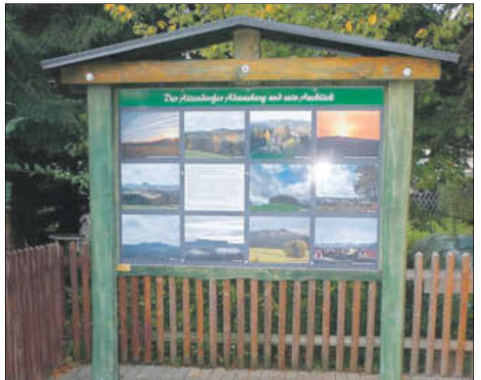
Neugestaltung des Adamsbergs in Altendorf, u.a. mit der Aufstellung einer Hinweistafel im Dorf.