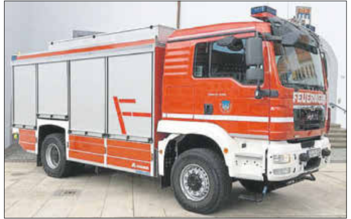
Der Stadtrat beschließt Ausschreibung und Vergabe von Leistungen zur Beschaffung eines TLF 4000 mit einem Auftragswert von ca. 360 T Euro. (Foto: analoge Bauform, TLF 4000 der Stadt Freiberg)