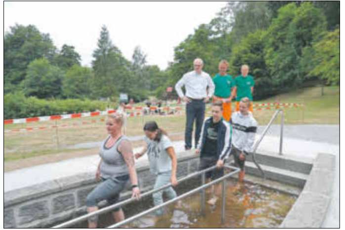
Freigabe des Wassertretbeckens im Naherholungszentrum Forellenschenke nach Sanierung am 5. Juli. Sanierung des Grillpavillons.