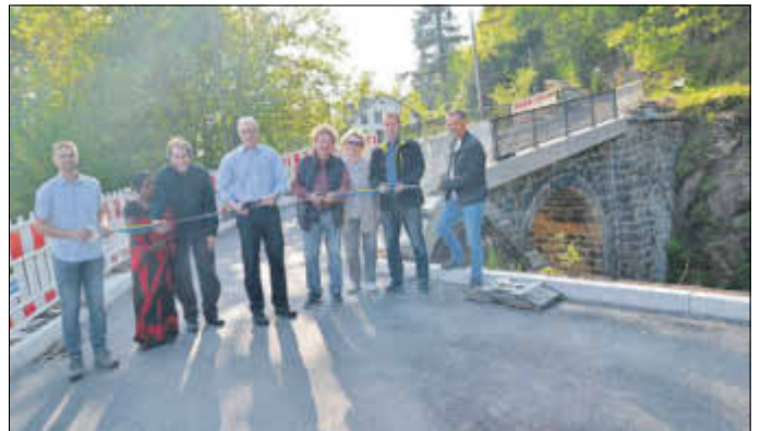
Die Bahnbrücke Heilige Leite wurde nach Sanierung im Mai für die öffentliche Nutzung freigegeben. Die Baukosten beliefen sich auf ca. 580 T Euro. Der Freistaat Sachsen hat die Maßnahme zu 90 % gefördert.