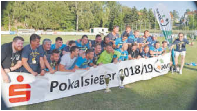
BSV 68 Sebnitz, 1. Fußball-Mannschaft, erkämpften den Meistertitel und Pokalsieg in der Kreisoberliga Sächsische Schweiz/Osterzgebirge im Spieljahr 2018/19.