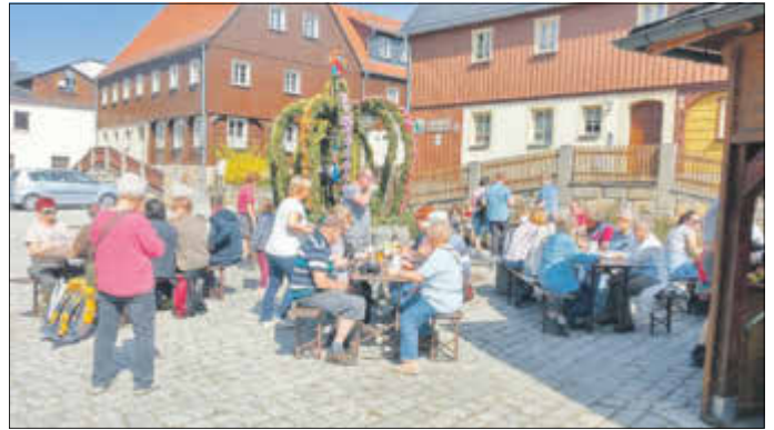
Der Heimatverein Hinterhermsdorf gestaltete wieder traditionell den Osterbrunnen.