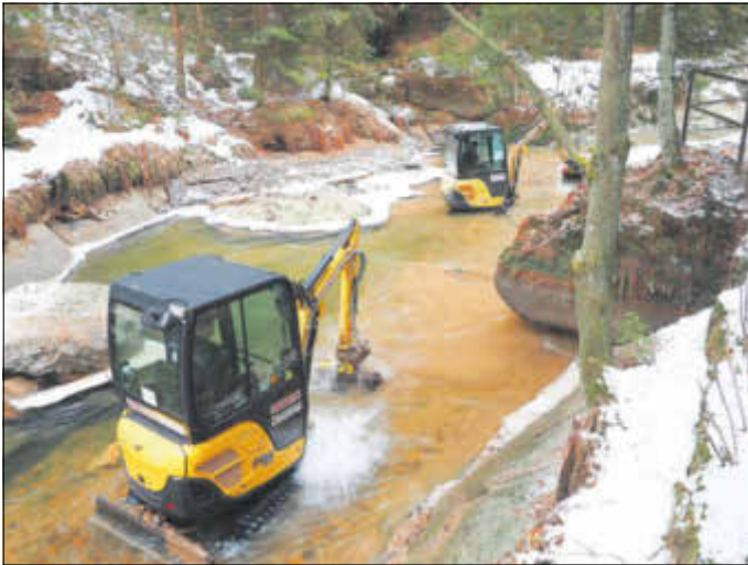
Die Sedimentumlagerung in der Oberen Schleuse in Hinterhermsdorf ist abgeschlossen. Die „Freunde der Oberen Schleuse“ haben die Rindenhütte nach schweren Unwettern saniert.