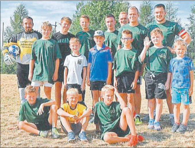
Sommerfest des Heimatvereins Altendorf, u.a. mit dem Fußballspiel „60 Jahre Väter gegen Söhne“.