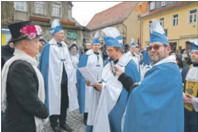
Beim 101. Faschingsumzug des Buchberg e. V. wurden 17 Bilder präsentiert.