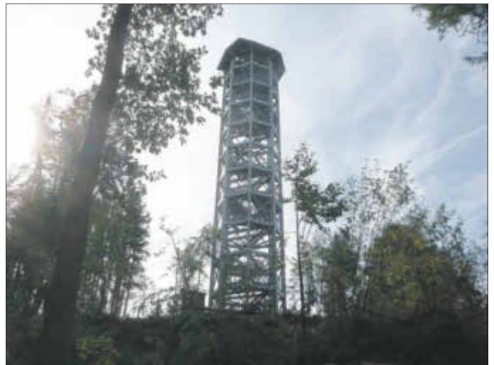
Durchführung des Weißbergturmfestes durch den Heimat- und Schützenverein Hinterhermsdorf mit Kinderbelustigung, kulinarischen Köstlichkeiten und den Sachsenländer Blasmusikanten.