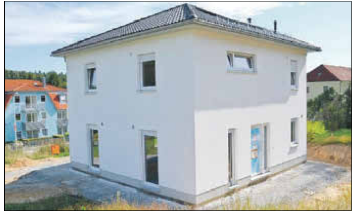
Errichtung eines Musterhauses am Eigenheimstandort Dr.-Hesse-Straße.