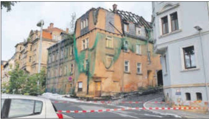
Großbrand am 17. Juni in der Kreuzstraße 23 – 100 Kameradinnen und Kameraden waren im Einsatz, trotzdem erleidet das Gebäude Totalschaden.