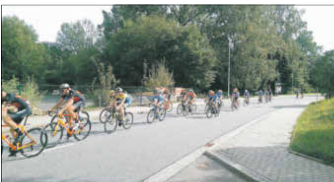
44. Volksbank Classics Straßenradrennen „Rund um Sebnitz“