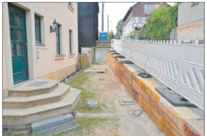
Der Stützmauerbau am Grundstück Talstraße 13 in Lichtenhain ist abgeschlossen. Kosten: 65 T Euro