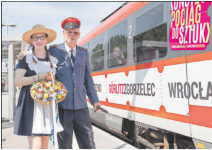
Die Nationalparkbahn feierte am 6./7. Juli das Streckenfest anlässlich des vor fünf Jahren vorgenommenen Lückenschlusses zwischen Sebnitz und Dolni Poustevna.