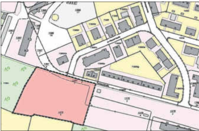
Stadtrat beschließt die Aufstellung eines Bebauungsplanes „Wohnen an der Pestalozzistraße“