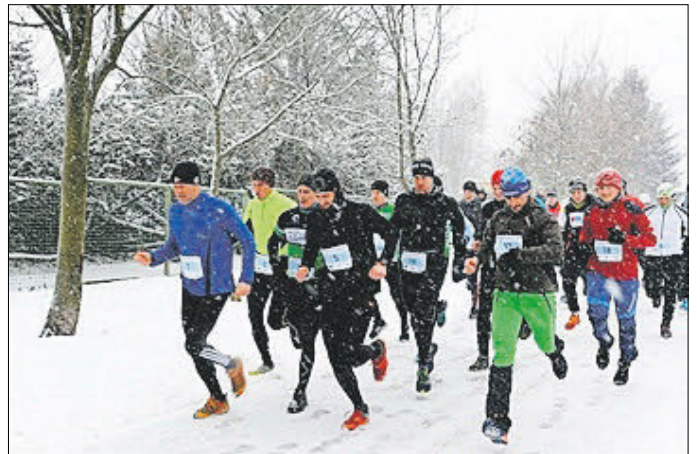
51. Sebnitzer Wuchterlauf – aufgrund Schneemangel als Crosslauf ausgetragen.