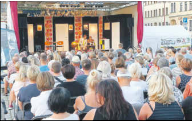
Besucherrekord zum diesjährigen Kultursommer – unglaubliche 4.000 Besucher kamen an allen Veranstaltungstagen auf den Sebnitzer Marktplatz.