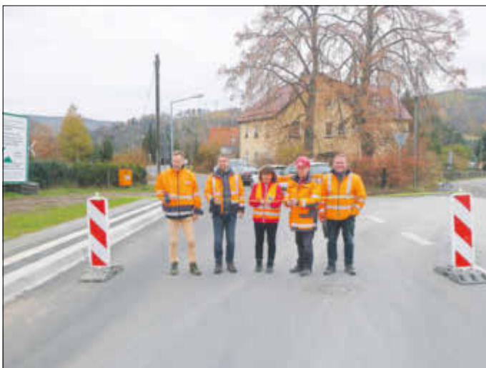
Verkehrsfreigabe der Ottendorfer Straße im Ortsteil Hertigswalde – endlich wieder freie Fahrt!