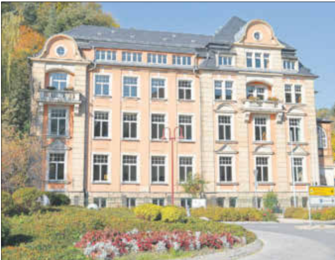
Umfangreiche Sanierungsarbeiten an den Sebnitzer Grundschulen im Rahmen des Schulinvest-Programms in Höhe von ca. 350 TEuro Investitionskosten.