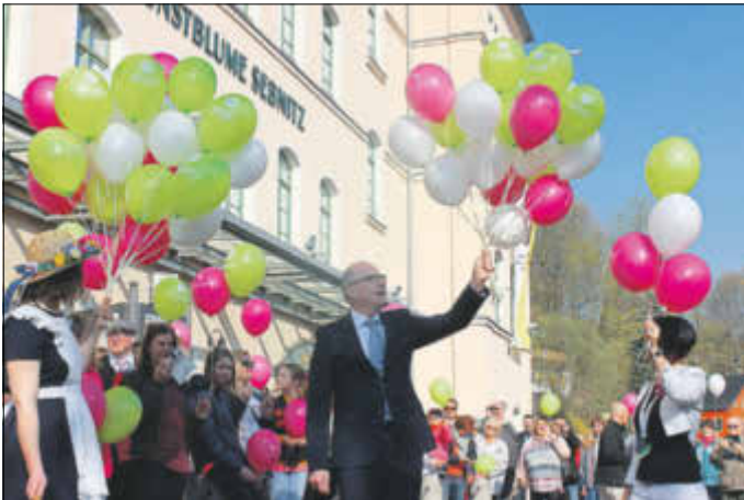
Die Jubiläumsveranstaltung „Manufakturenwelt“ am 7. April anlässlich 185 Jahre Deutsche Kunstblume besuchten über 1.500 Gäste.