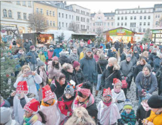
Die 7. Sebnitzer Tannert-Weihnacht zählte wieder zu den schönsten Weihnachtsmärkten der Region.

Absoluter Besucheransturm war erneut die Sebnitzer Museumsnacht. Mit Lampionumzug, Sachsenländer Blasmusikanten, Lichter- und Feuershow, Eiskönigin Elsa samt Anna und Olaf, offenen Museen, Theatre Libre, Fotoausstellung von Ullrich Jentzsch etc. war für jeden etwas dabei.