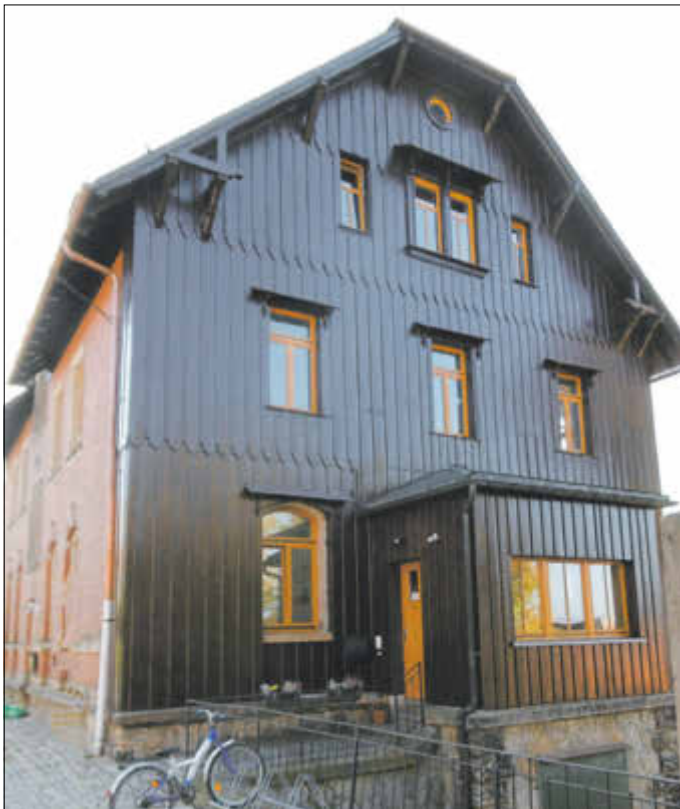
Dach- und Fassadensanierung am Haus des Kindes Hinterhermsdorf – Gesamtkosten ca. 70.000 Euro