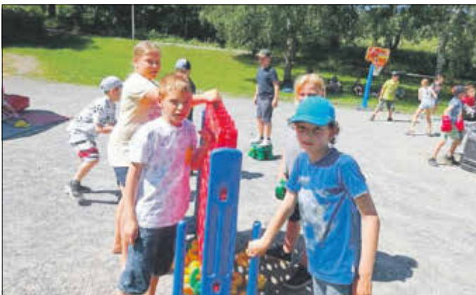
Grundschule Schandauer Straße begeht 25-jähriges Jubiläum mit Kinderfest in der Forellenschänke.