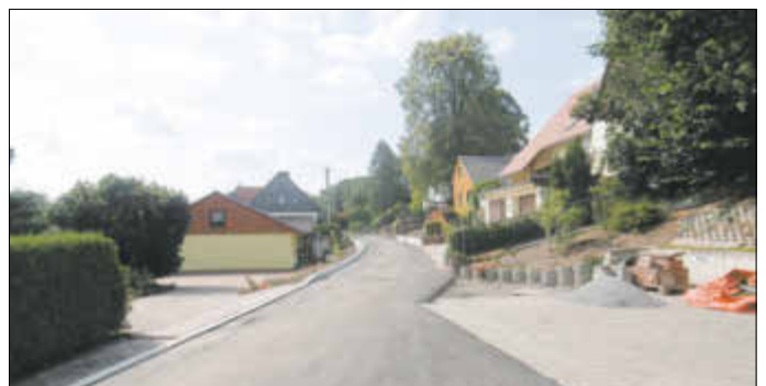
Die Baumaßnahme Sportplatzweg Ottendorf, die Bestandteil des Eingemeindungsvertrages Sebnitz – Kirnitzschtal ist, wurde planmäßig abgeschlossen. Kosten: 213 T Euro