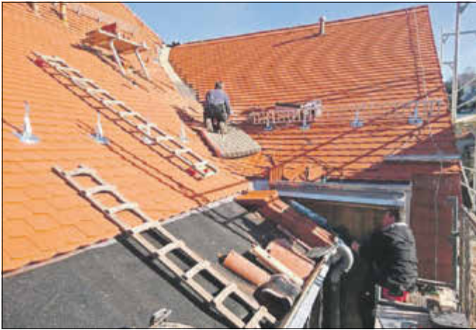
Dachsanierung und Malerarbeiten am Goethe-Gymnasium Sebnitz. Erneuerung der Freitreppe am Haus I.