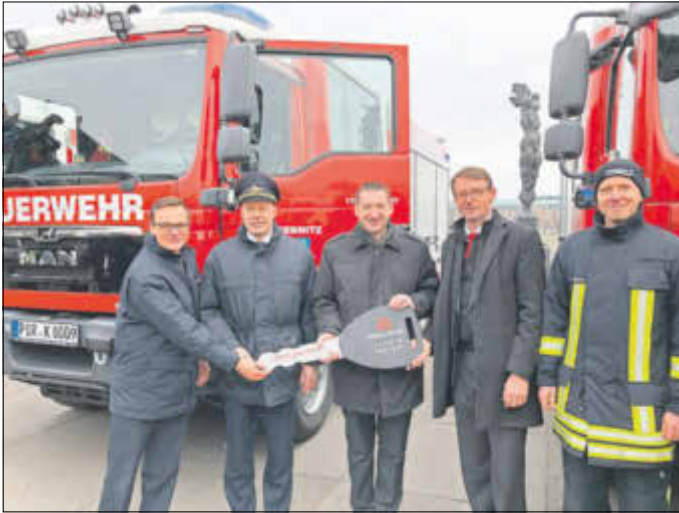
Offizielle Übergabe des HLF 10 (Hilfeleistungslöschfahrzeug) im Sächsischen Landtag an die Lichtenhainer Kameraden. Das Fahrzeug ist durch den Freistaat Sachsen beschafft und finanziert.