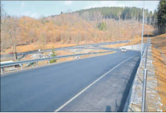
Der Ausbau der Gartenstraße vom Bahnhof bis zur Einmündung auf die S 154 erfolgte von 2016 bis 2019.