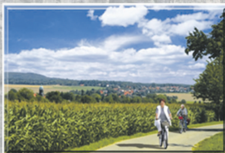
Blick auf Lohmen